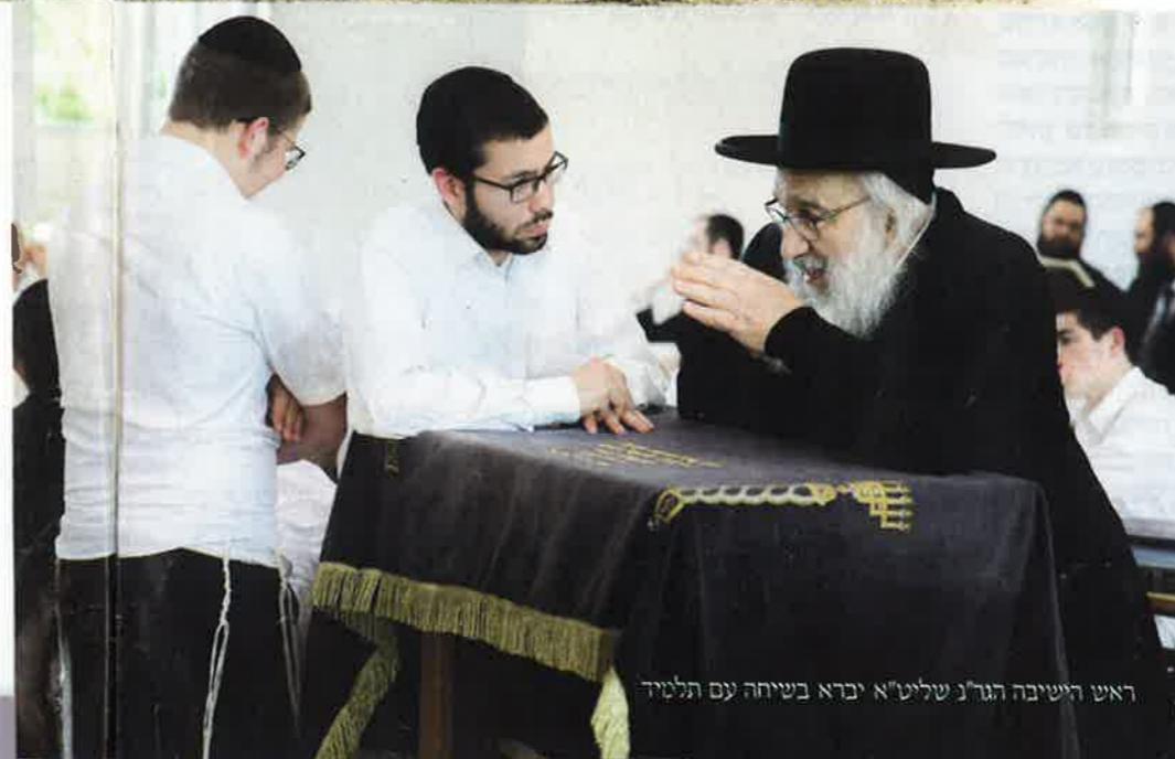
ראש הישיבה הגאון שליט"א יברא בשיחה עם תלמיד

בהמשך אנו מגלים, שהנערים הצעירים הללו, מפיחים בוקעים הקולות, היו אמורים בכלל לסלול את דרכם – אם ניתן לקרוא לזה כך – במבואותיה התוססים, הצבעוניים והאפלים של פריז הסמוכה. תחת זאת, הם