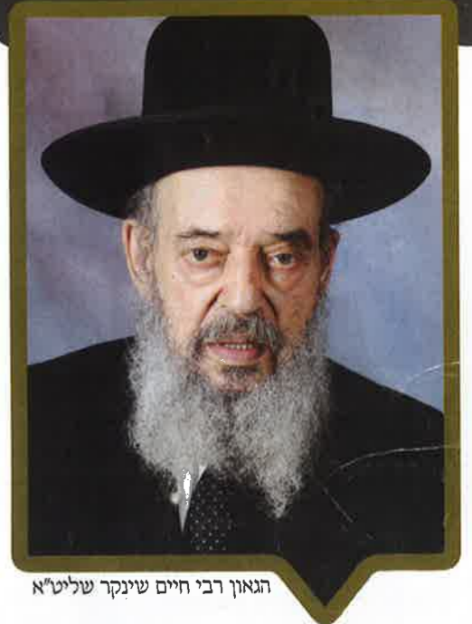
הגאון רבי חיים שינקר שליט"א